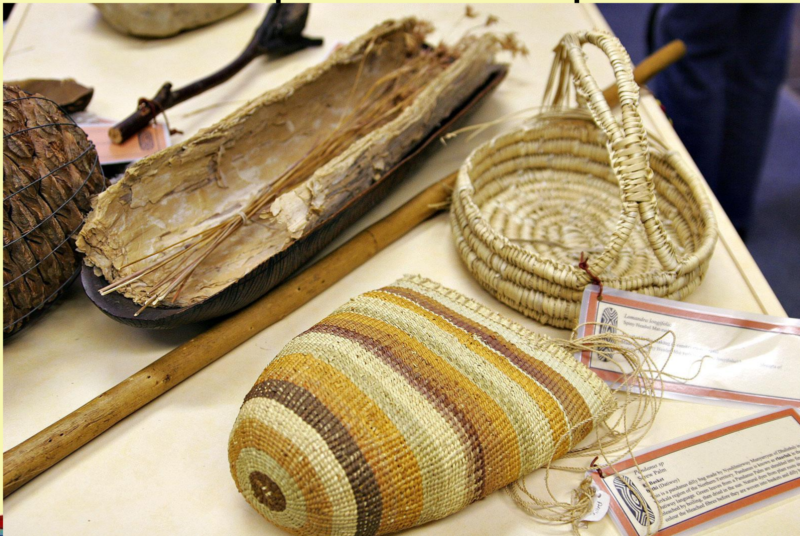
Образцы рукоделия аборигенов Австралии