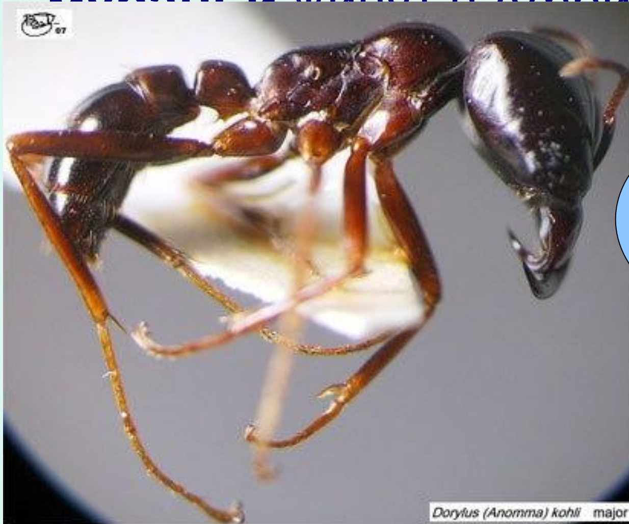
Dorylus (Anomma) kohli major