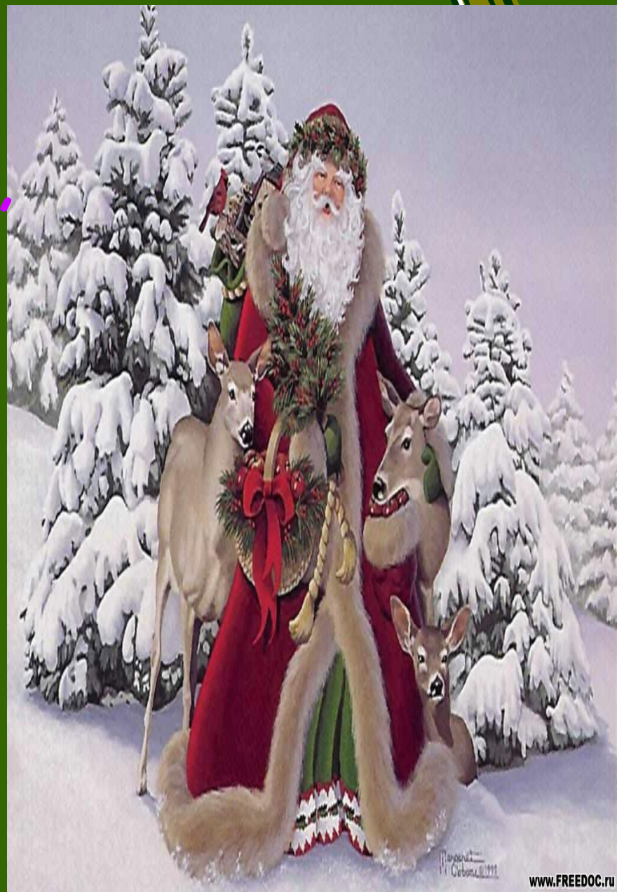
Иллюстрация © Сибирь, 2011