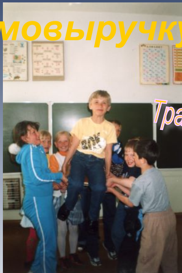
Традиционный "День именинника"