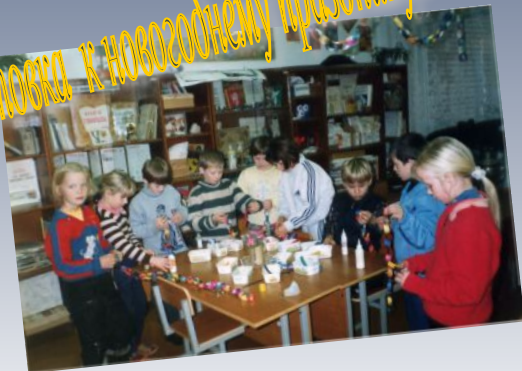
Дружная подготовка к новогоднему празднику.