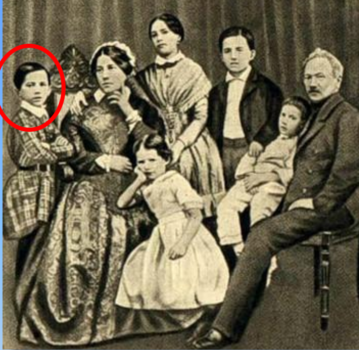
Семья Чайковских в 1848 году (крайний слева — Пётр Ильич)

Родился 25 апреля 1840 года в селении при Камско - Воткинском заводе Вятской губернии (ныне город Воткинск, Удмуртия). Пётр был вторым ребёнком в семье.