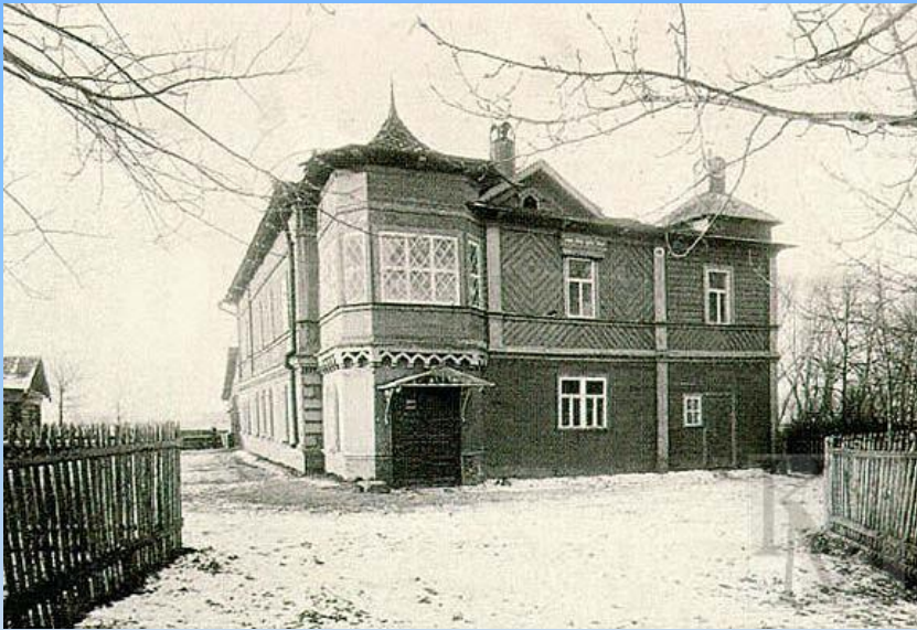
Дом П. И. Чайковского в Клину. 1893 год.

В 1892 году обосновался в Клину, под Москвой