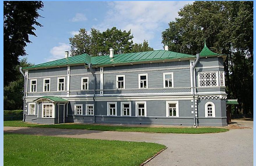
Ныне Дом-музей им. Чайковского