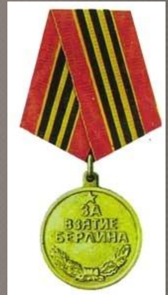
Медаль «За взятие Берлина»