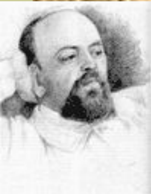
С. И. Мамонтов

1885 г. – частный оперный театр С. И. Мамонтова