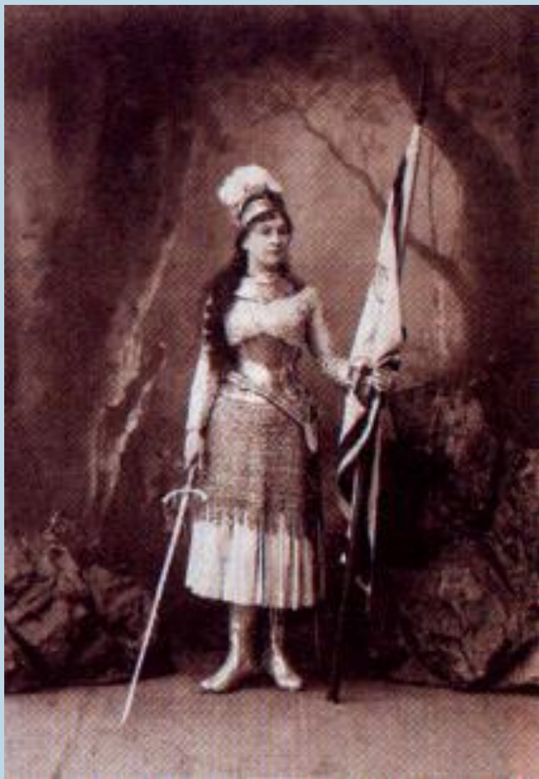
М.Н.Ермолова в роли Жанны д'Арк.

Ведущее место в развитии русского театра сыграл Малый театр. Специально для него писал пьесы, а затем ставил их А.Островский. В Петербурге блистал Мариинский театр. 2я пол.19 века дала целую плеяду выдающихся актеров, появились актерские династии- Садовские, Самойловы, Васильевы. «Звездой» русского театра стала М. Н.Ермолова—прима Малого театра.