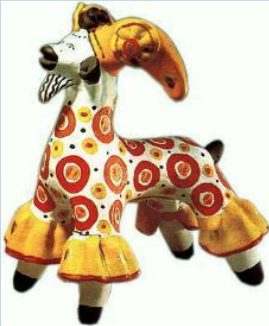
Цирковой козел. Дымковская игрушка.

В селе Дымково близ Вятки изготавливали глиняные игрушки-свистульки в виде людей, животных, птиц. Их раскрашивали яркими анилиновыми красками. Характерной чертой дымковской игрушки стали пышные воротники, оборки, яркий геометрический орнамент.