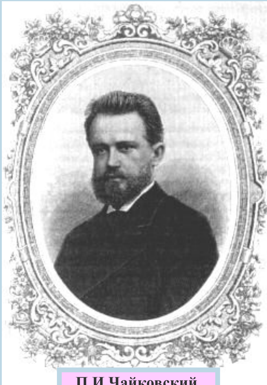
П.И.Чайковский. Фотография 1860 г.

Величайший вклад в сокровищницу мирового музыкального искусства внес П.И.Чайковский. Его оперы «Евгений Онегин», «Пиковая дама», балеты «Лебединое озеро», «Спящая красавица» и др. составляют гордость репертуара крупнейших театров во всем мире.