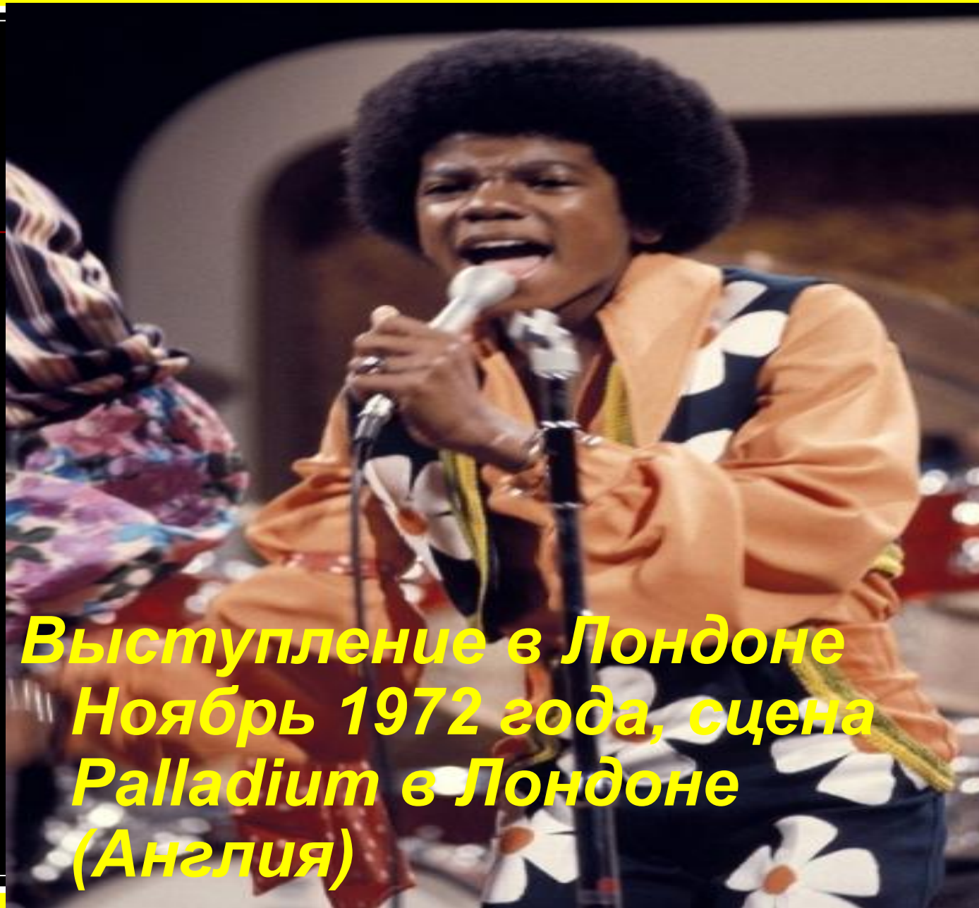
Выступление в Лондоне Ноябрь 1972 года, сцена Palladium в Лондоне (Англия)