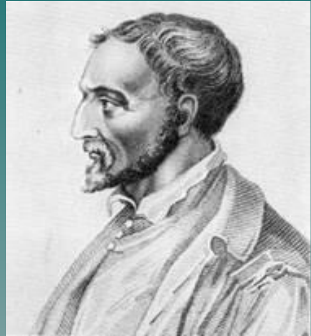
Кардано (1501-1576 г.)