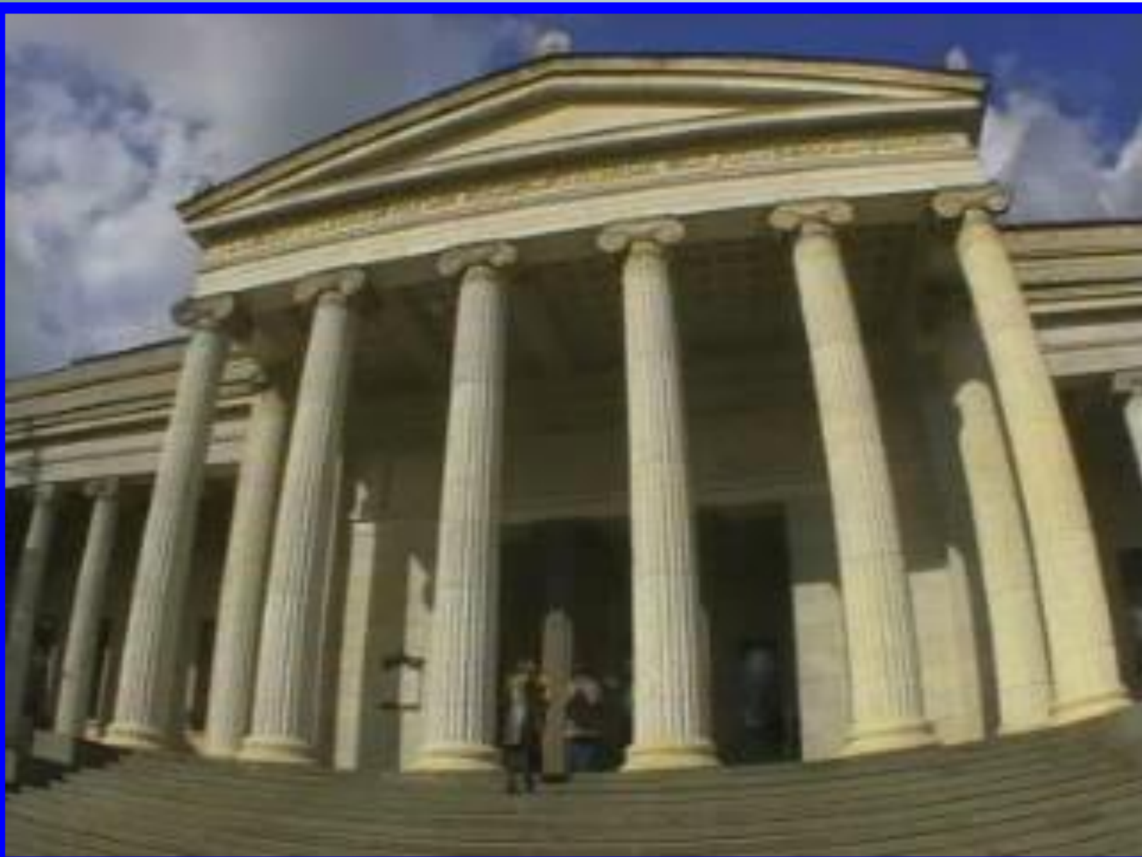
Музей изобразительных искусств имени Пушкина.