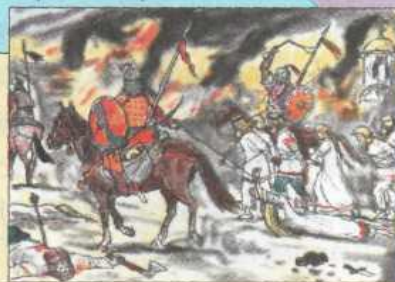
Набег на русское селение.