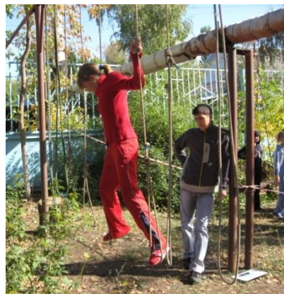
Преодолевать искусственные препятствия