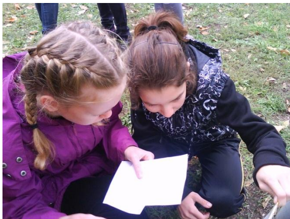
Ориентироваться на местности