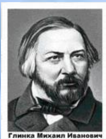
Глинка Михаил Иванович

1833 год. Новая мелодия и новые слова в гимне «Боже царя храни».