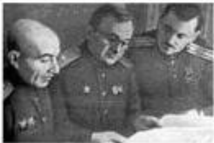
Авторы гимна СССР (слева направо): писатель Г.А. Эль-Регистан, композитор А.В. Александров и поэт С.В. Михалков