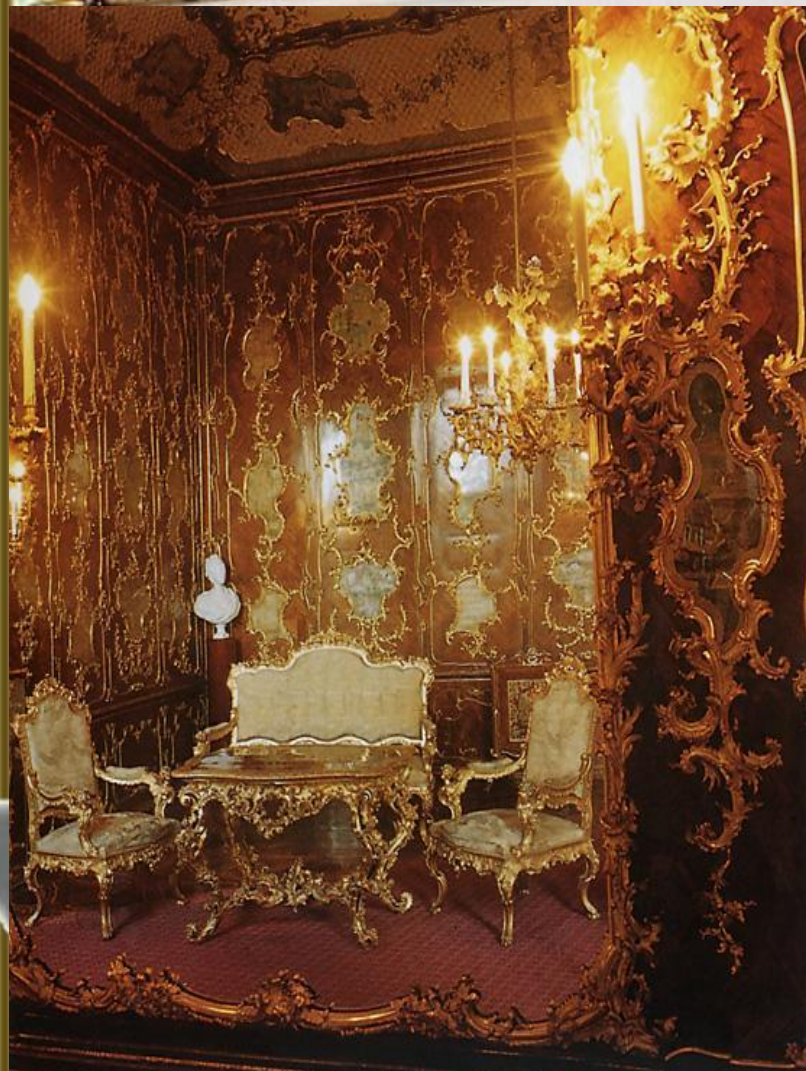
Миллионная комната. Дворец Шёнбрунн. 1767. Вена.