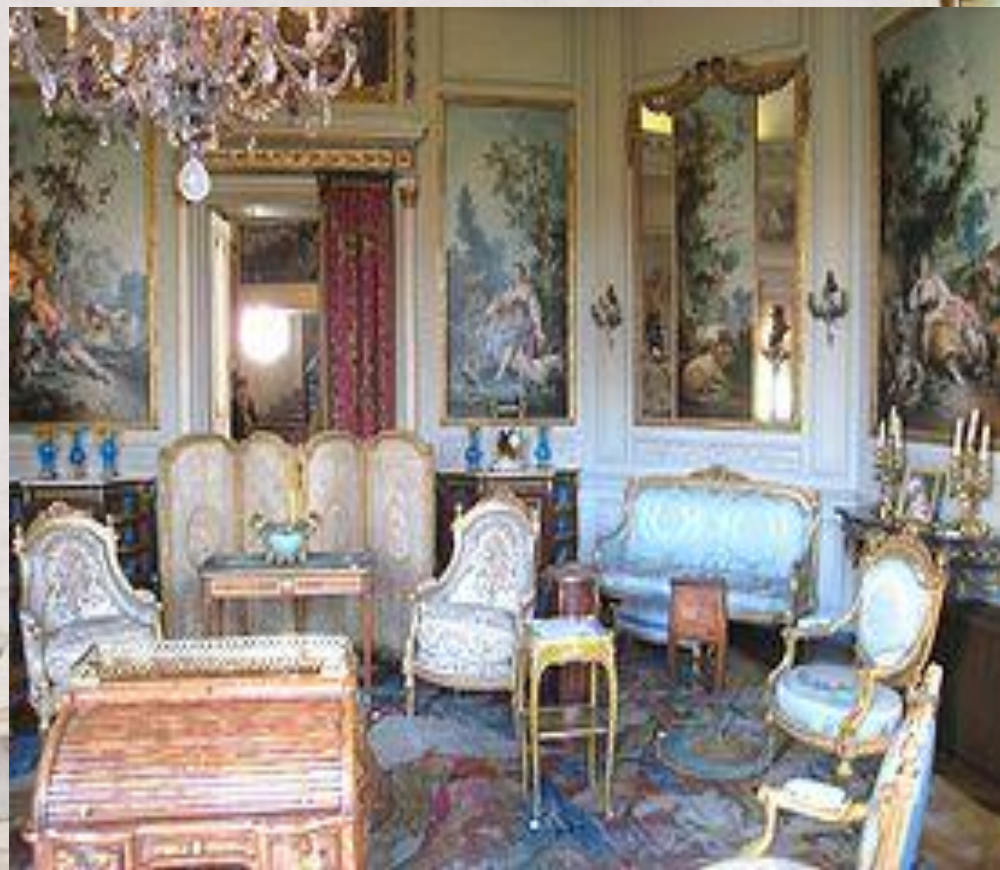
Интерьер в стиле Луи XV. Музей Ниссим-де-Камандо.