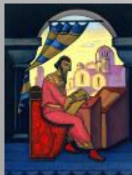
Ярослав Мудрый (Н. К. Рерих)