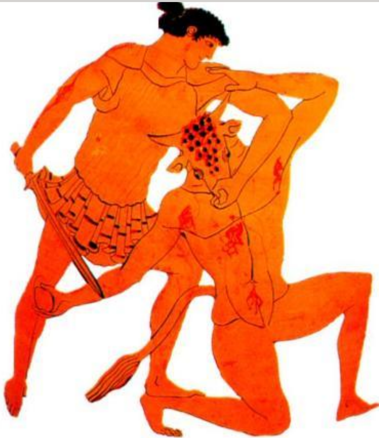
Тесей и Минотавр. Рисунок на критской вазе.

Одним из самых известных мифов посвященных Криту был миф о Тесее и Минотавре В нем афиняне отразили свой страх перед разрушительными природными катастрофами. О чем говорится в мифе?