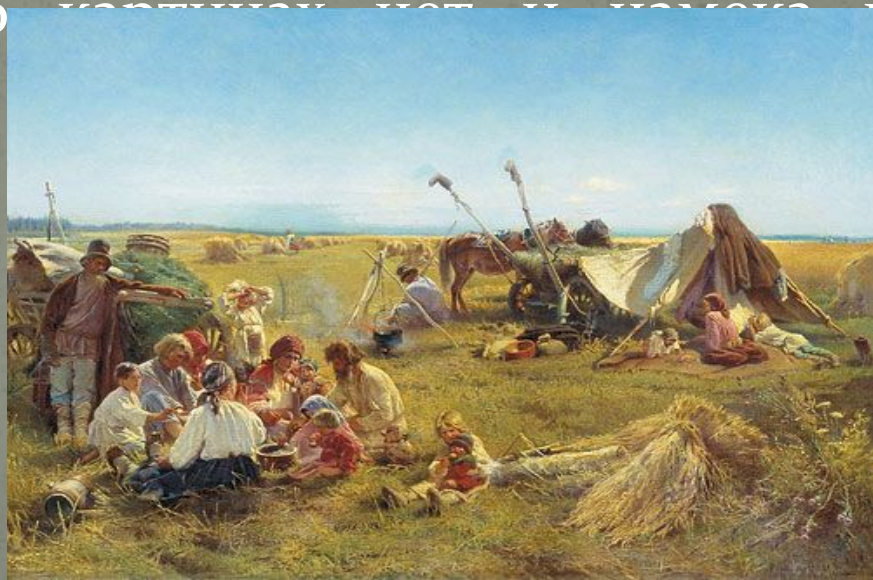
К. Маковский «Крестьянский обед в поле»