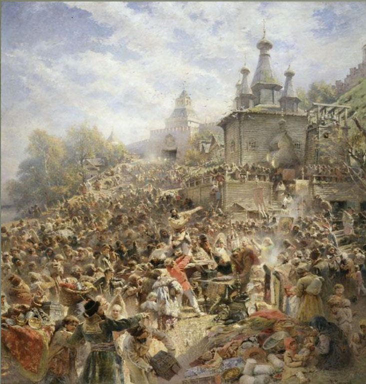
К. Маковский «Воззвание Минина»