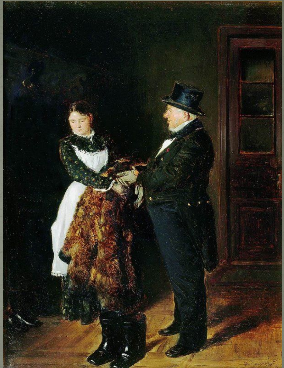
В. Маковский «В передней»