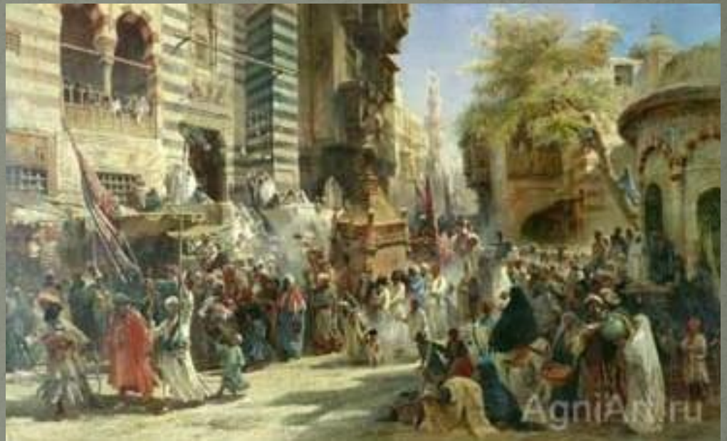
К. Маковский «возвращение священного ковра из Мекки в Каир»