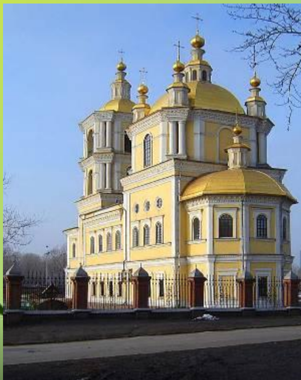
Первый храм Новокузнецка Спасо-Преображенский