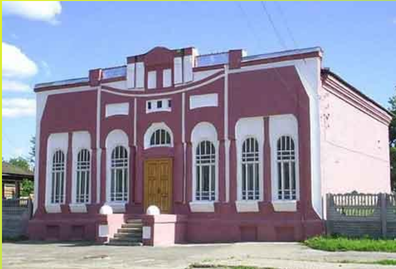
Новокузнецкий краеведческий музей — самый первый музей Кузбасса