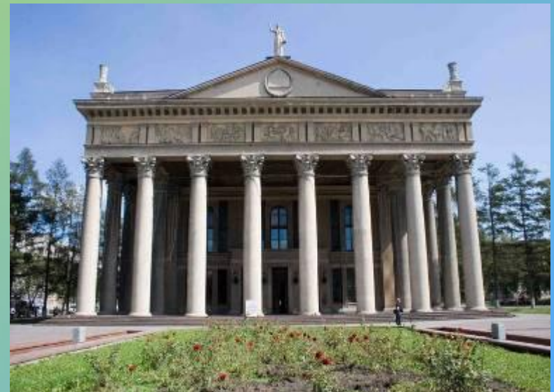
Новокузнецкий драматический театр