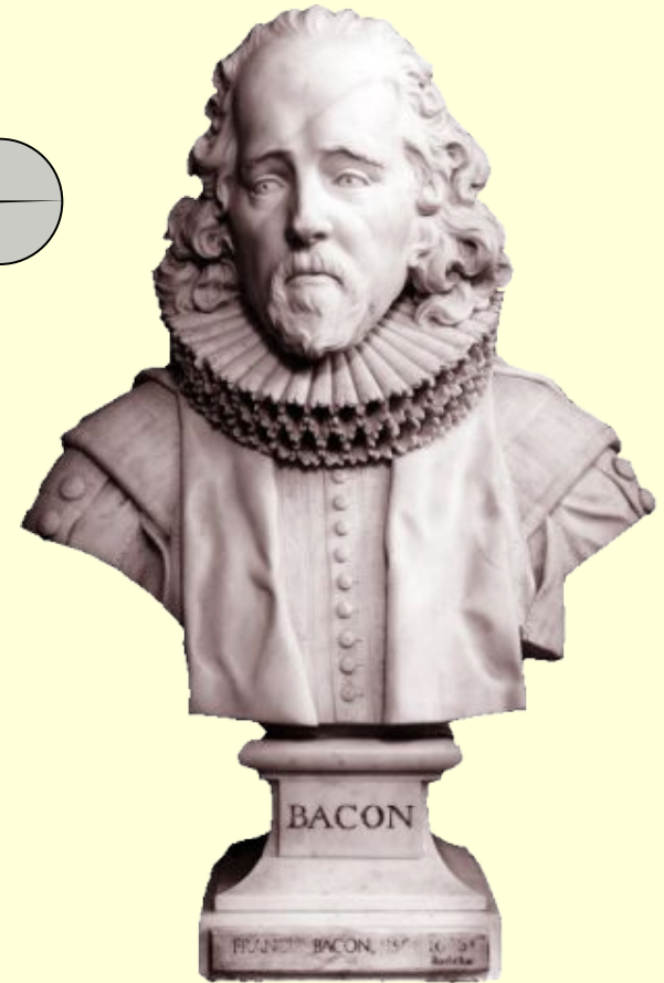
Ф. Бэкон. «Новый Органон».

Человек, слуга и истолкователь природы, столько совершает и понимает, сколько постиг в её порядке, делом или размышлением, и свыше этого он не знает и не может.