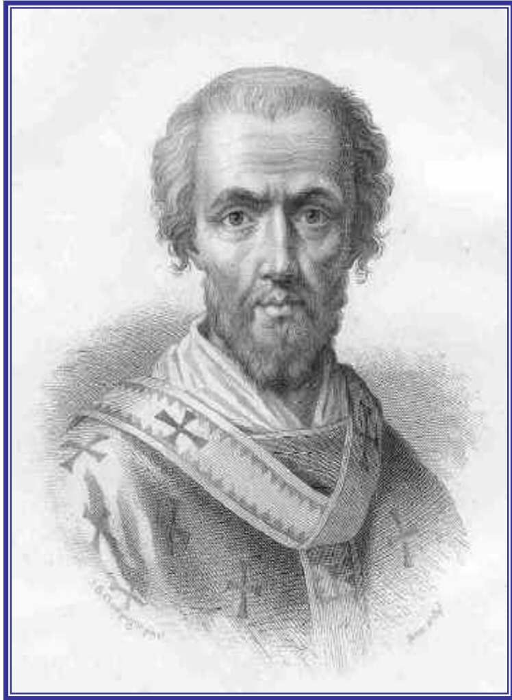
Святитель Иоанн Златоуст

«Мы всей природой пробуждаемся к милосердию, и нет в нашей природе другого столь доброго свойства. Милосердие происходит от любви. Если мы не имеем милосердия и сострадания, мы не имеем ничего»