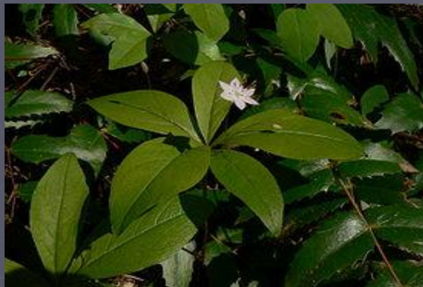
Седмичник (сырые леса)