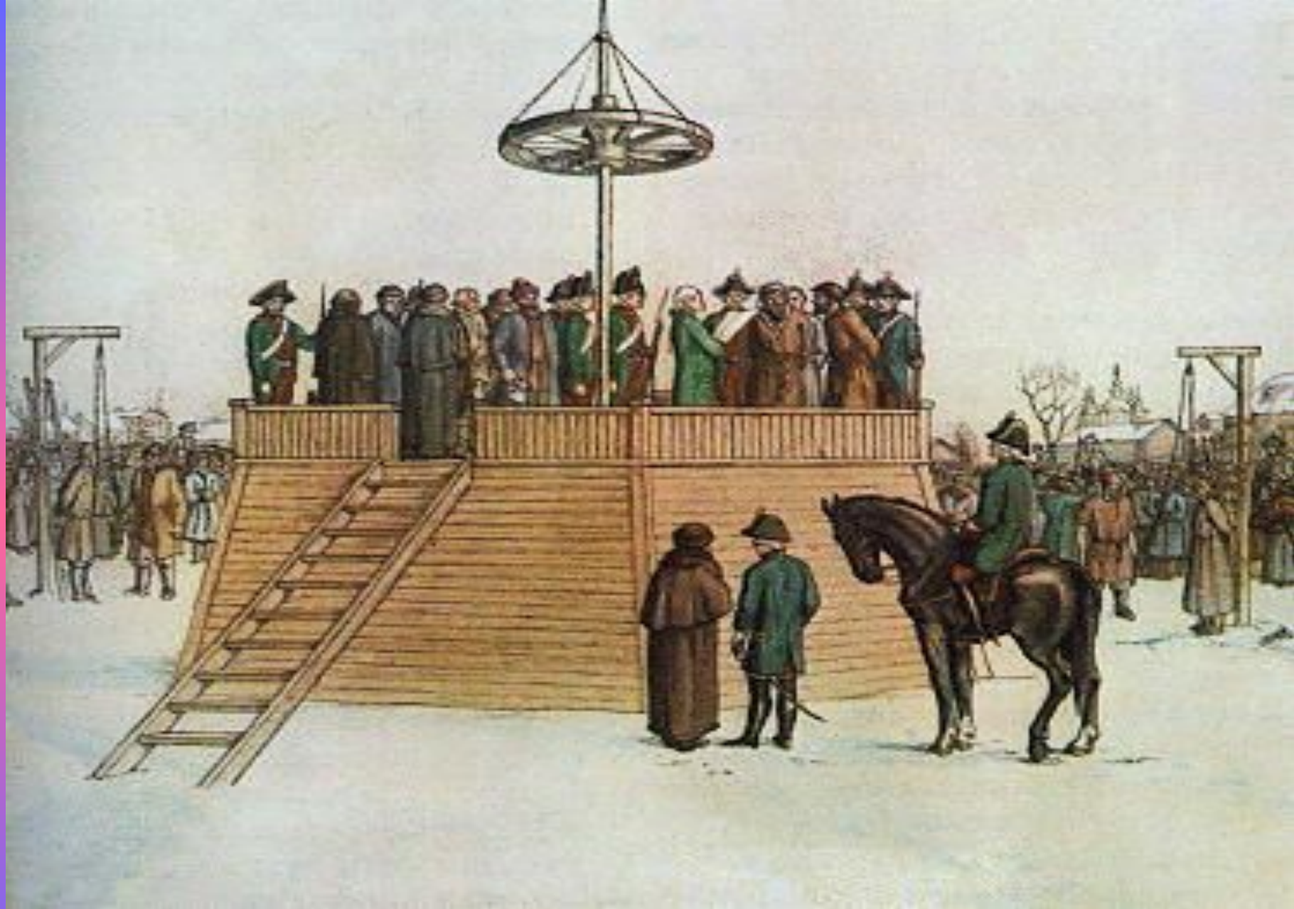
Казнь Пугачева и его соратников в Москве