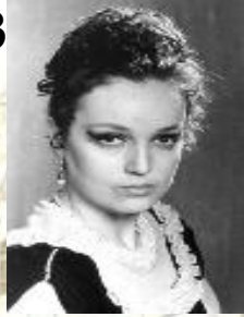
3) Евгений Онегин