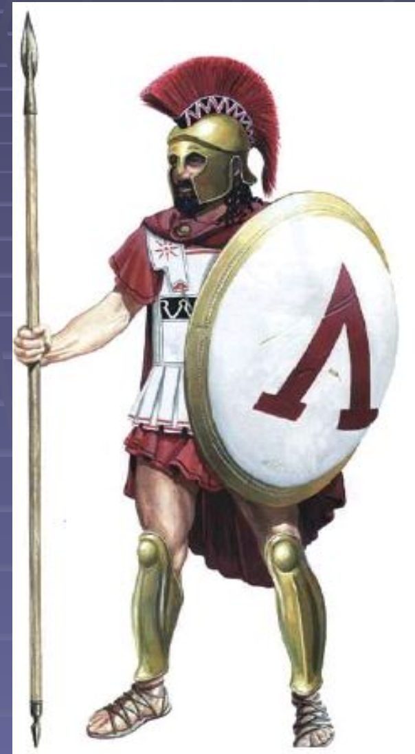
Спартанский ВОИН →