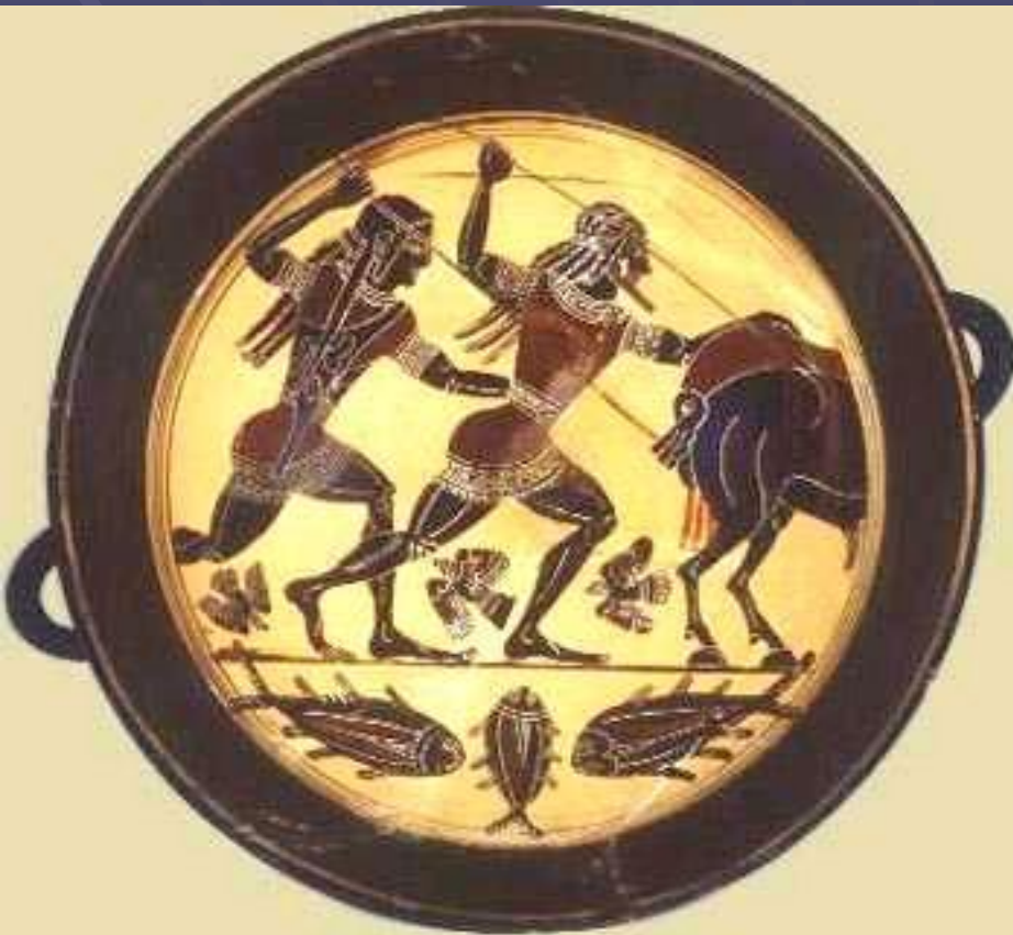
← Охота на кабанов