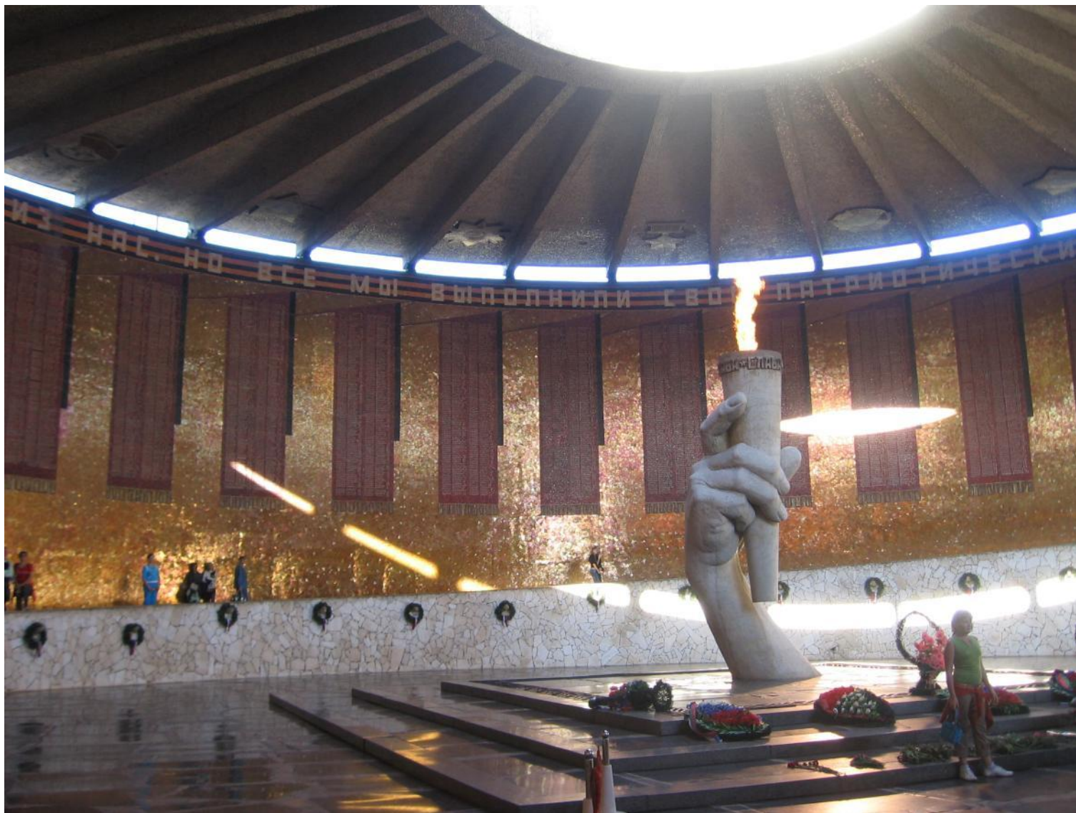
В Зале Воинской Славы звучит музыка, горит Вечный огонь