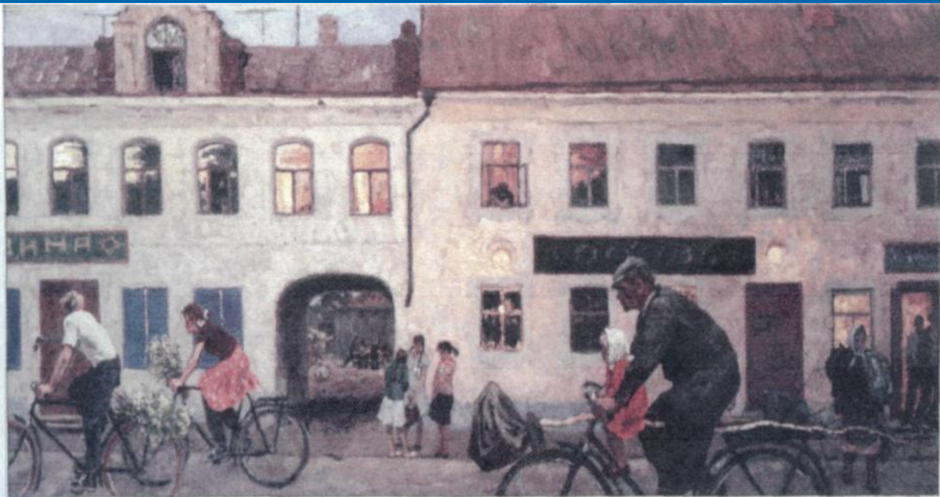
А. Тутунов Вечер в Переславль-Залесском 1960-е