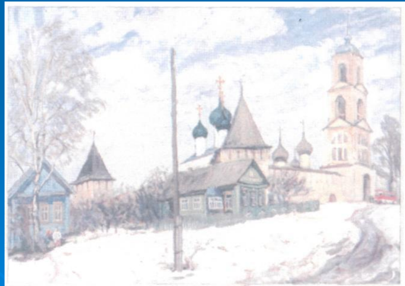
Д. Нечитайло Никитинский монастырь