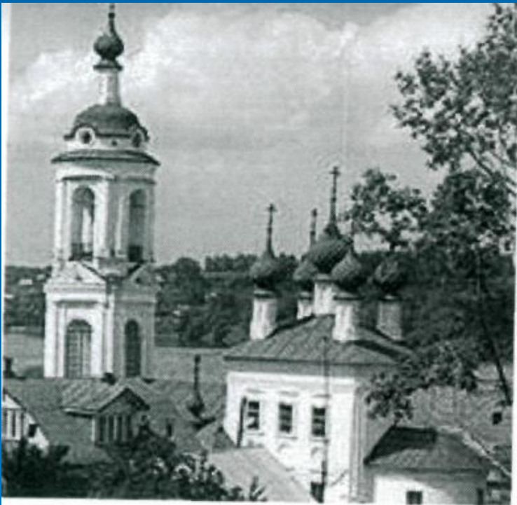
Плес. Церковь Варвары Великомученицы.