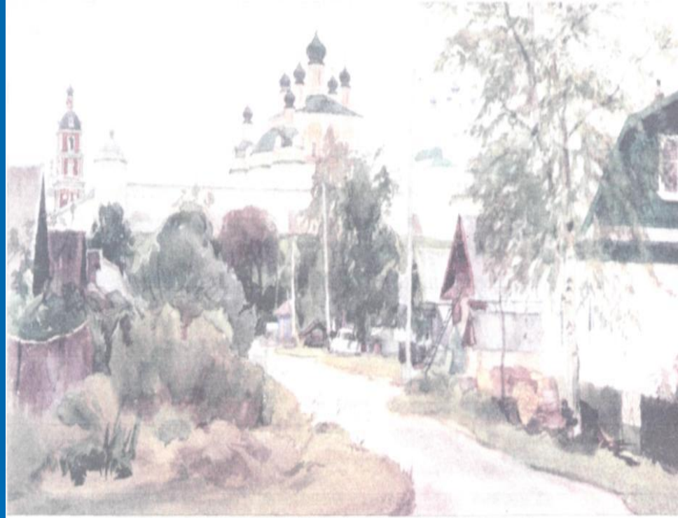
А.Устинович Переславль-Залесский. Некрасовский переулоч 2000