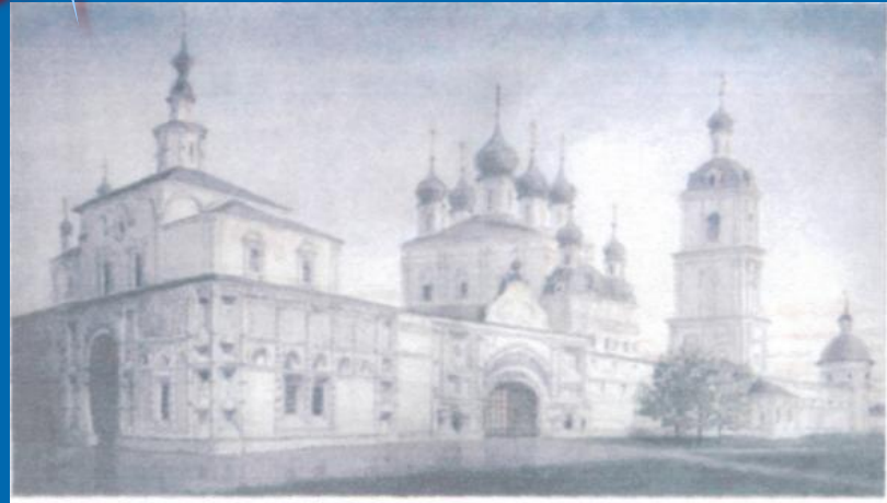
Г.Лебелев Переславль-Залесский, Горницкий монастырь

Благодаря торговому пути Переяславль быстро рос и развивался. Вскоре он стал центром самостоятельного удельного княжества. В 1238 году, как и все города владими́ро-суздальской земли, Переяславль подвергся нападению полчищ Батыя, был разграблен и сожжен.