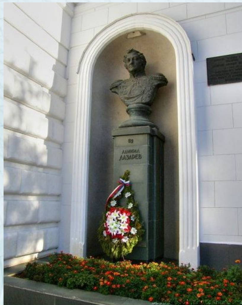
Севастополь. Памятник Лазареву М.П