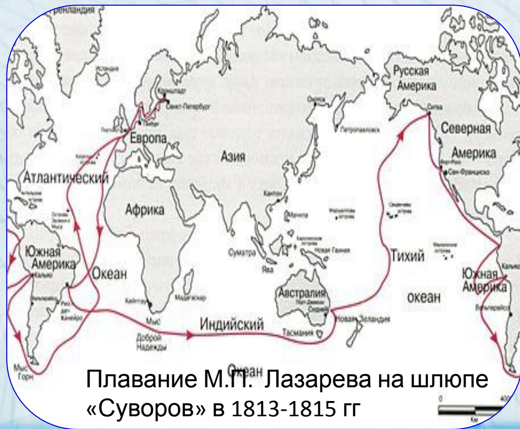
Плавание М.П. Лазарева на шлюпе «Суворов» в 1813-1815 гг

В 1808—1813 годах служил на Балтийском флоте. В 1813 году лейтенант Лазарев получил новое назначение — командовать шлюпом «Суворов», отправляющимся в кругосветное плавание вокруг земного шара.