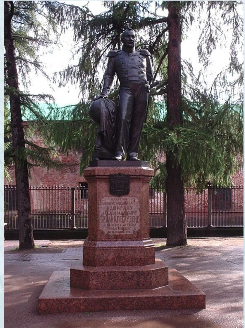
Памятник адмиралу Ф. Ф. Беллинсгаузену в Кронштадте