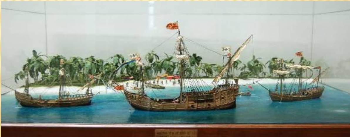
Модели «Санта – Марии», «Пинты» и «Ниньи».