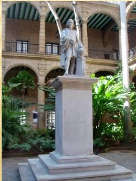
Памятники Х. Колумбу

Умер Колумб в испанском городе Вальядолиде 21 мая 1506 в присутствии брата Диего, сыновей Диего, Эрнандо и нескольких друзей по экспедиции. Его останки были перевезены в Севилью в 1513, а затем примерно в 1542, перезахоронены в соборе города Санто-Доминго (ныне Доминиканская Республика).