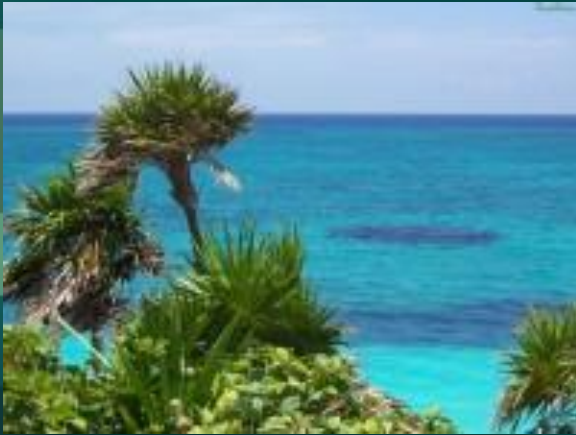
Остров Мадагаскар, Индийский Океан

Это огромная экосистема, условно разделенная на связанные между собой части: Атлантический, Тихий, Индийский и Северный Ледовитый океаны.