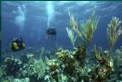
На дне океана

В тропиках лучи солнца попадают в воду почти под прямым углом и проникают на глубину 200-250 м. Ближе к полюсам они скользят по поверхности воды и проникают на гораздо меньшую глубину. Поэтому зона фотосинтеза в тропиках гораздо разнообразнее. По мере удаления от суши живой мир океана также меняется.