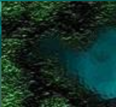
На дне Океана