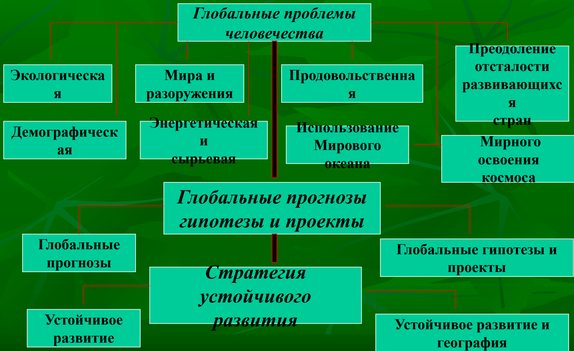
Схема глобальных проблем