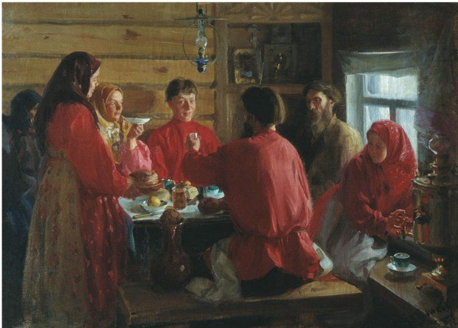
Традиционная или патриархальная семья.