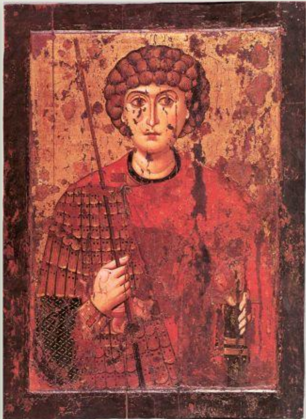
Византийский образ Святого Георгия - Победоносца, 12в.