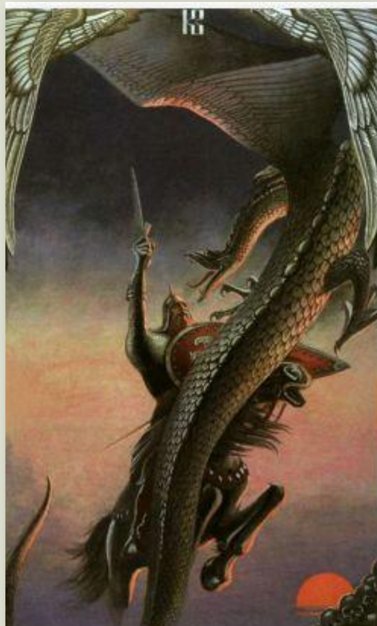
Константин Васильев «Бой со Змием» 20в.