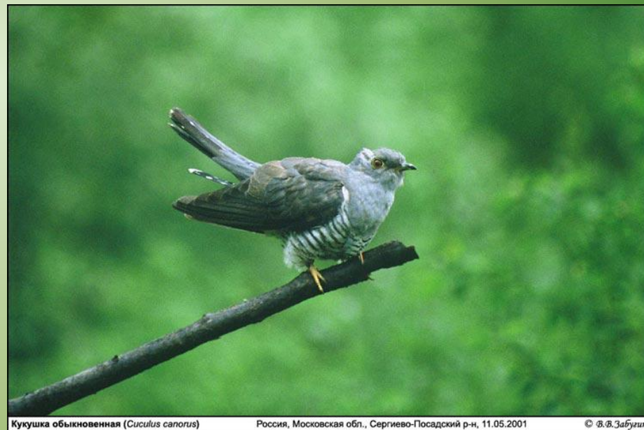
Кукушка обыкновенная ( Cuculus canorus )

Кукушечка, кукушечка, Серенька рябушечка, Прокукуй в лесу: ку-ку – Сколько лет я проживу?