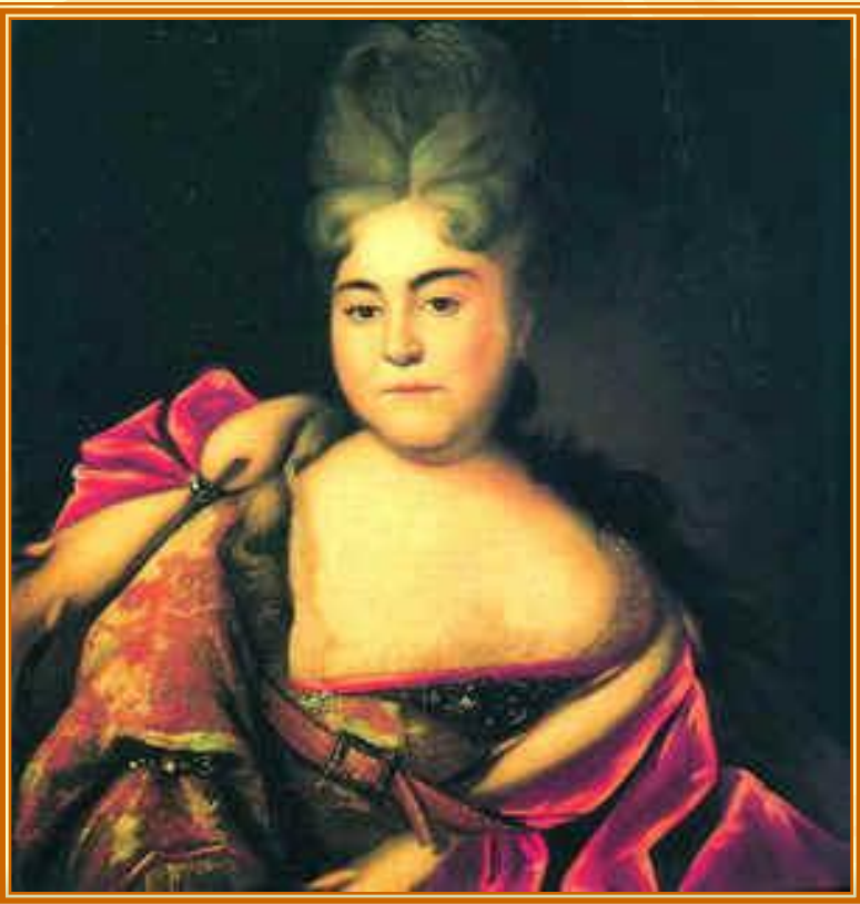
Портрет царевны Натальи Алексеевны