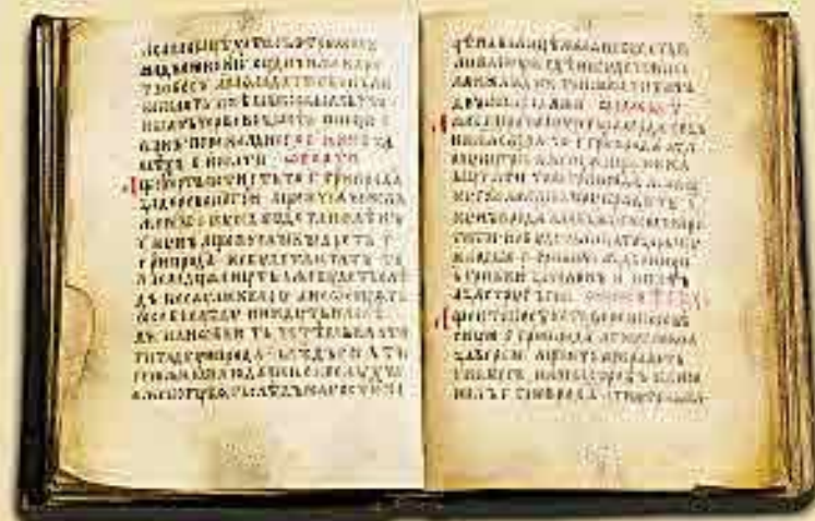
Русская правда. Рукопись XIV в.

Русская Правда Старейший древнерусский свод законов — Русская "Правда". Этот документ создавался на протяжении XI—XII веков. Начало ему около 1016 года положил Ярослав Мудрый (это прозвище появилось в исторической литературе в XIX веке). Во второй половине XI века сыновья Ярослава дополнили Русскую Правду новыми законами.