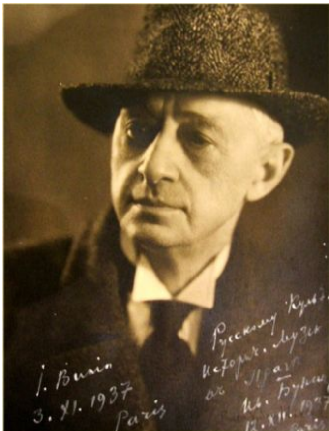
И. А. Бунин

К началу 20-х гг. из страны эмигрировали многие выдающиеся писатели, художники, музыканты: И. А. Бунин, А. И. Куприн, К. Д. Бальмонт, В. Ф. Ходасевич, М. Шагал, И. Е. Репин, С. С. Прокофьев, С. В. Рахманинов, Ф. И. Шаляпин и др.