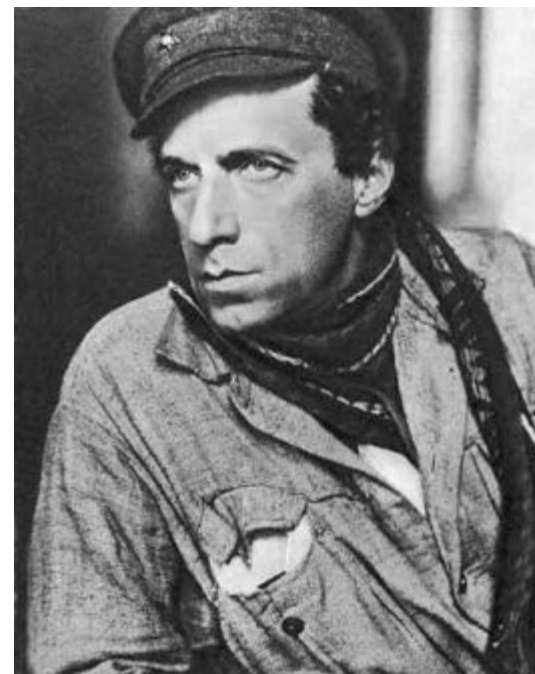
В. Э. Мейерхольд