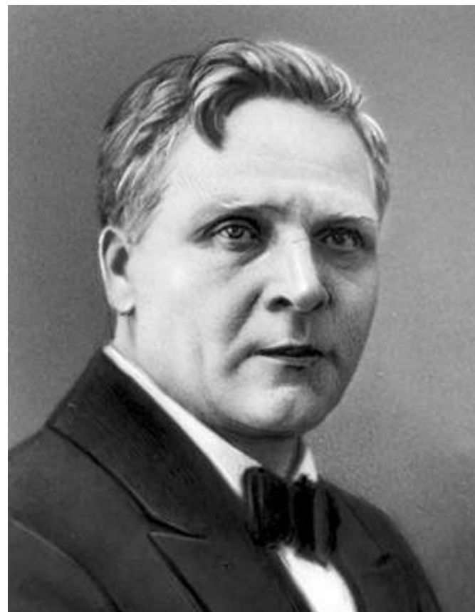
Ф. И. Шаляпин