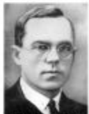
Н. Д. Кондратьев

Н. Д. Кондратьев, А. В. Чаянов, философ П. А. Флоренский и др.