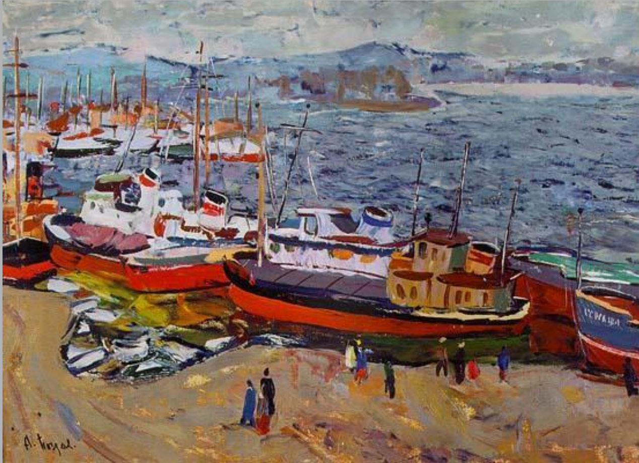
Весна на Енисее.