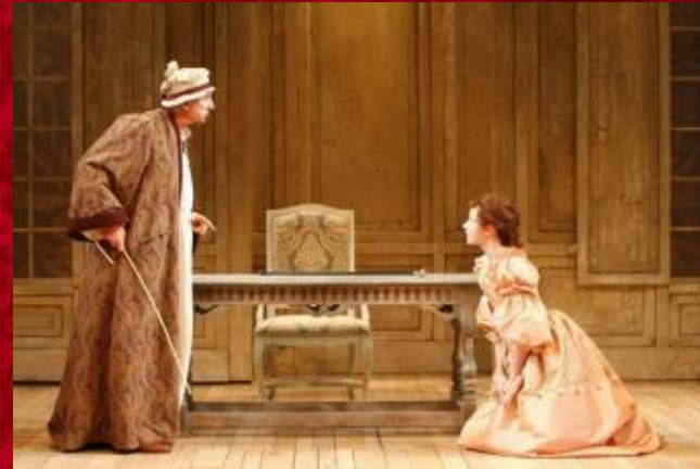
The Imaginary Invalid Shakespeare Theatre Company, Washington