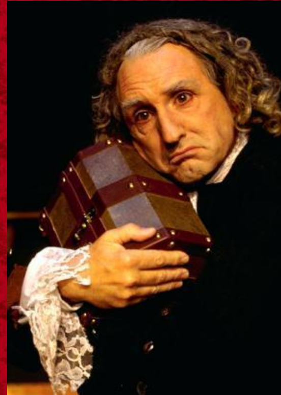
“The Miser” Shakespeare Theatre Company, Washington