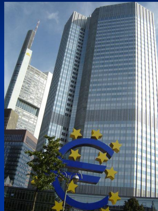
Европейский ЦБ во Франкфурте, Германия

(refinancing rate) — процентная ставка, под которую ЦБ предоставляет кредиты коммерческим банкам