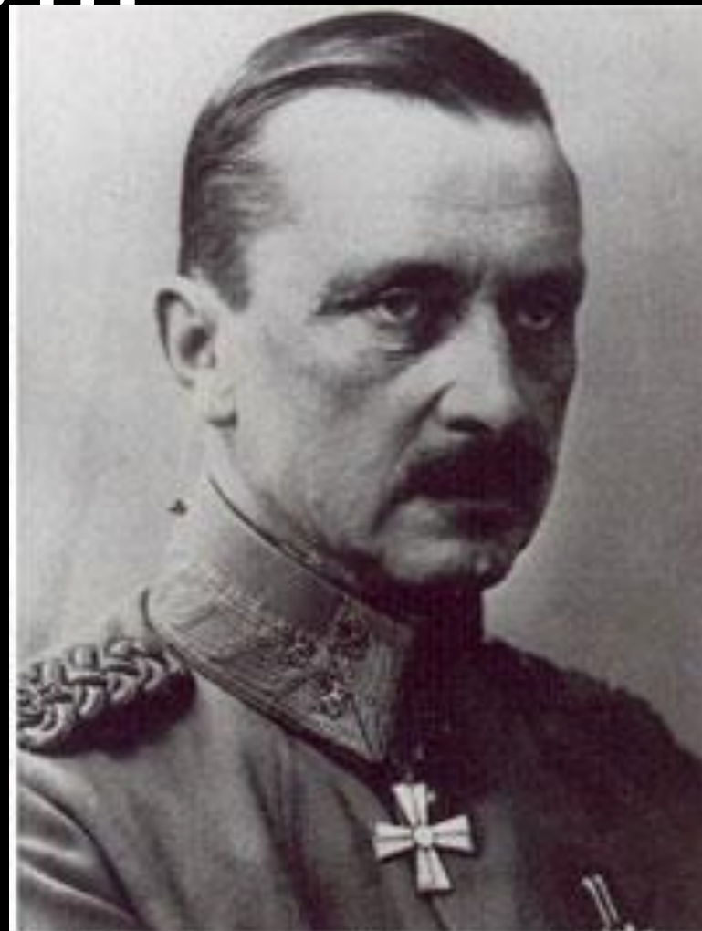
Карл Густав Маннергейм

-апрель 1939 г.- возобновлены переговоры: СССР предлагал военную помощь, а в ответ Просил передать в аренду на 30 лет п-в Ханко - отказ.