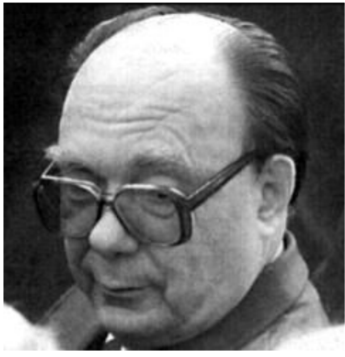
Секретарь ЦК КПСС по идеологии А.Н.Яковлев.

Гласность привела к переосмыслению прошлого. В печати были подняты «закрытые» прежде темы, критике подверглись ближайшие соратники Ленина.