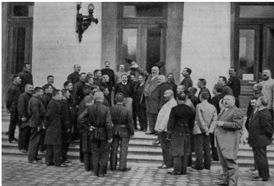
М. В. Родзянко и канцелярия Думы

С 1913 г. большинство Думы (кадеты, прогрессисты, радикалы) стали в оппозицию царизму: Николай II неоднократно ставил вопрос 'Об уголовной ответственности депутатов за их критические и разоблачительные речи с думской трибуны.