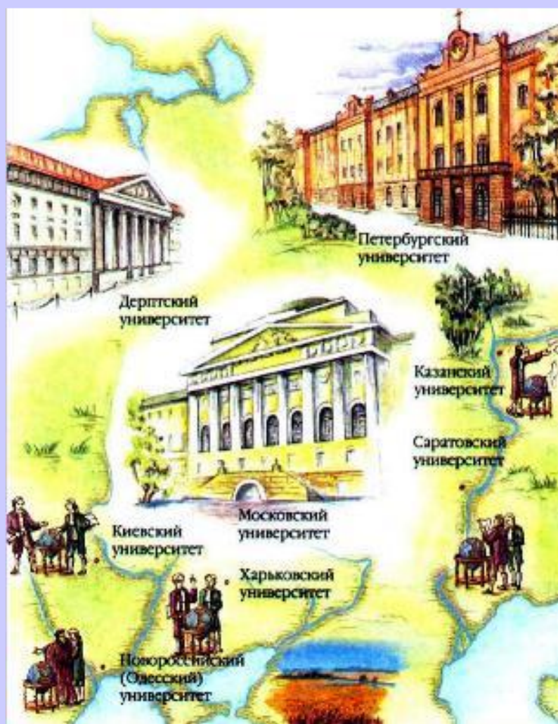
Университеты России в 19 веке.

После реформы 1803г. система образования состояла из 4-х ступеней: