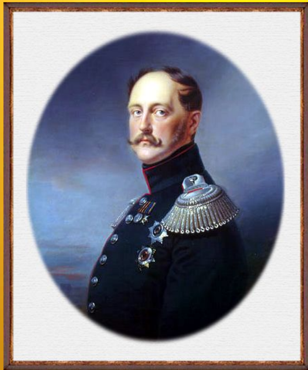
Портрет императора Николая I

На этом уроке вы познакомитесь с рассказом Л.Н.Толстого «После бала», повествующем об эпохе правления Николая I. Всю жизнь Толстой призывал «каждого человека к Нравственному обновлению, к борьбе со своими недостатками к созданию своей нравственной ответственности за все свои поступки» . Именно эти проблемы и подняты в произведении.