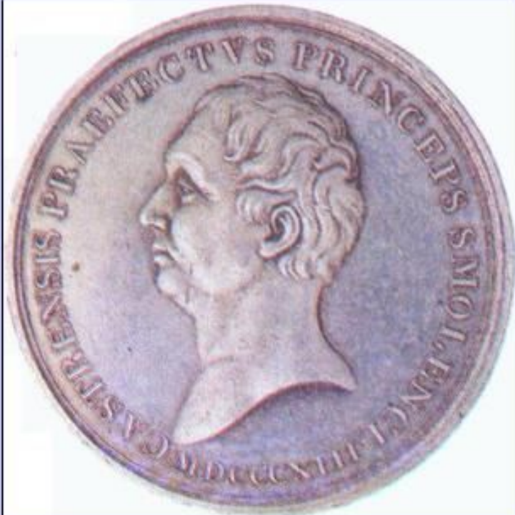
Т.Холидей.Медаль В честь М.И.Кутузова.

К несчастью, находясь в Пруссии, М.Кутузов простудился и несмотря на все усилия врачей 28 апреля скончался.