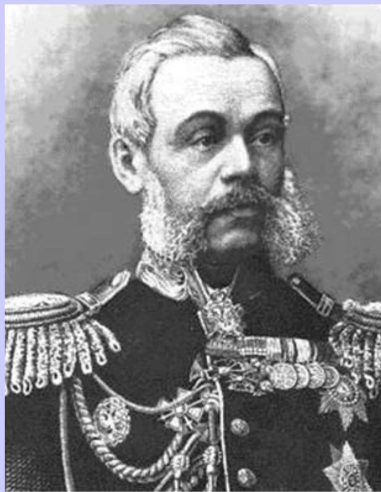
Военный министр Д.А.Милютин

В 1874 г. была проведена военная реформа по инициативе Д.А.Милютина.