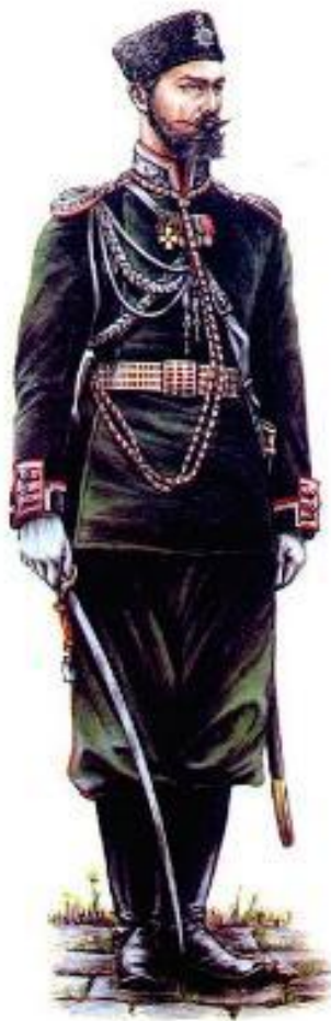
Офицер Генерального штаба.

В армии отменялись телесные наказания, улучшался быт и обучение солдат.