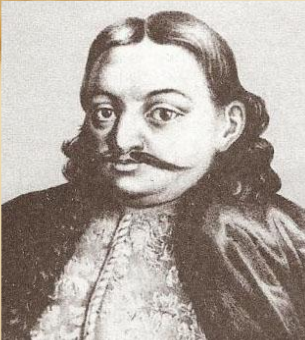
Федор Юрьевич Ромодановский