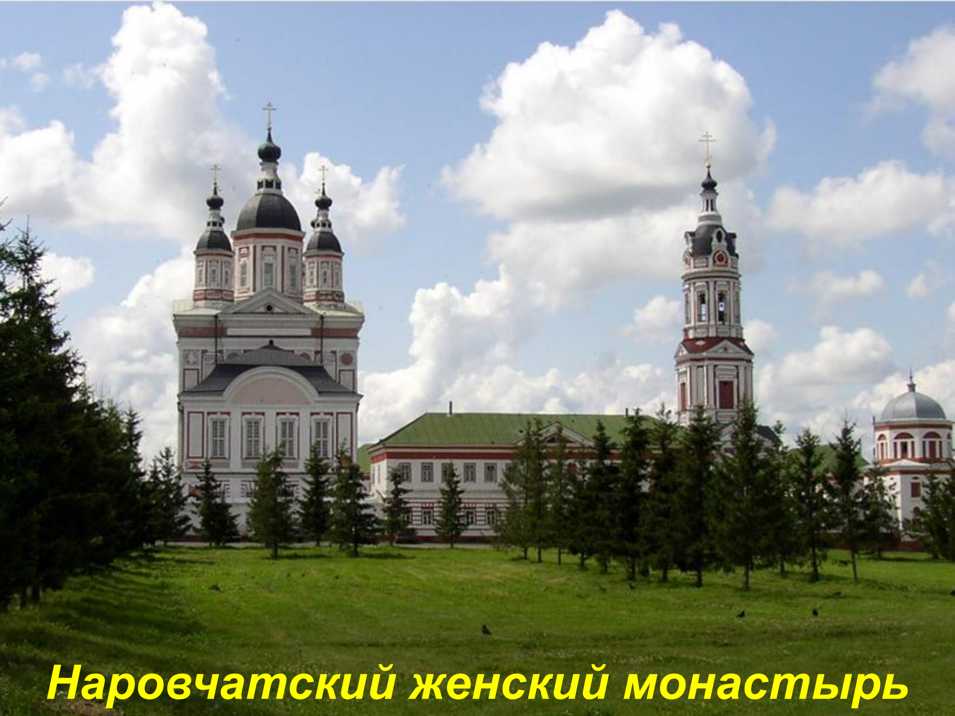
Наровчатский женский монастырь