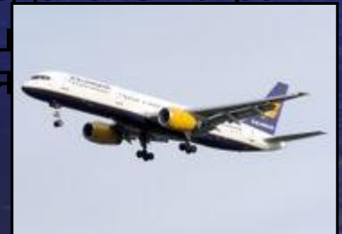
Боинг 757-200 авиакомпании