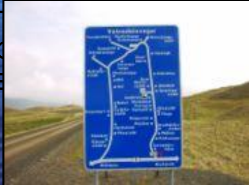
Типичный Исландский дорожный указатель.

Строительство автодорог началось в 1900-е годы. С 1980-х гг. сеть автодорог была существенно расширена. Большое распространение