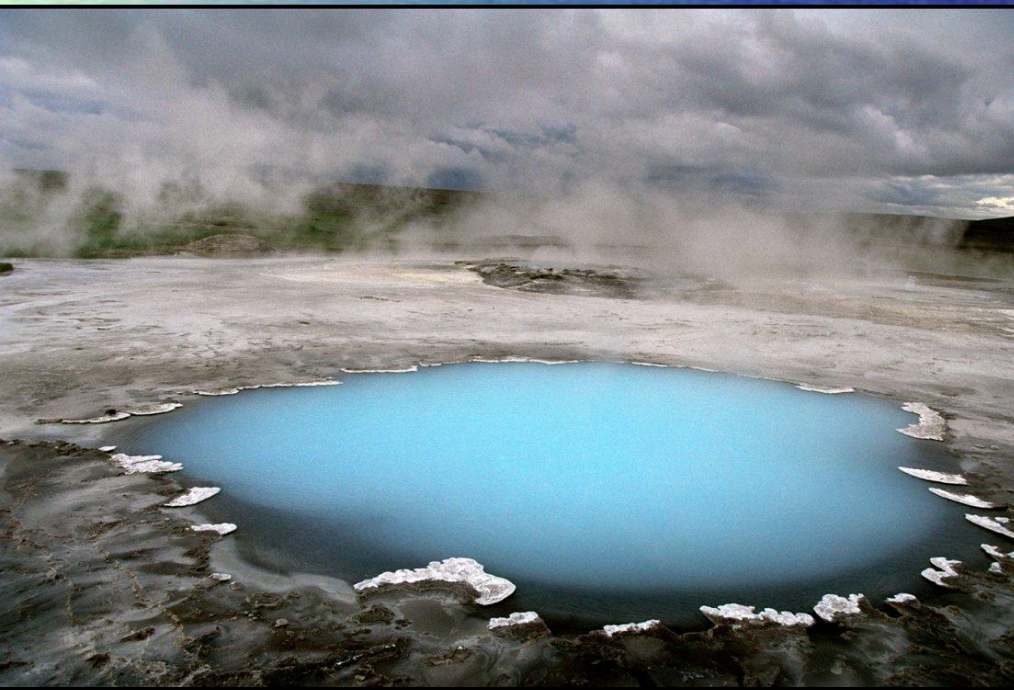
Голубое Око Божье